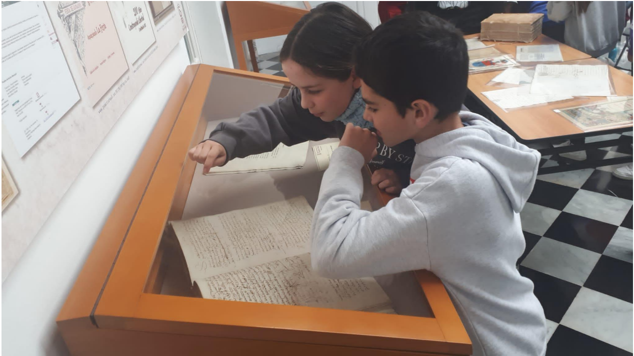
Talleres con Navantia