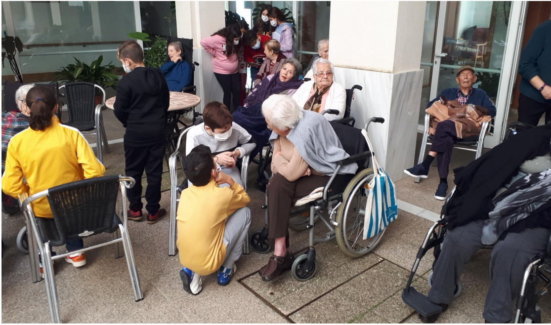
Talleres ofrecidos por CADE (Centro de desarrollo empresarial)